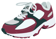
Los zapatos/Los tenis