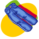
Los jeans/Los vaqueros