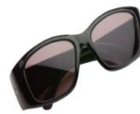
Unas gafas (de sol)