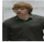
La familia de Ronald Weasley