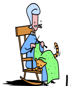
La Sra Potter es la abuela de Harry