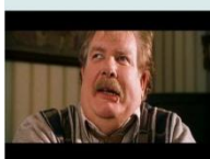
Vernon es el tío de Harry