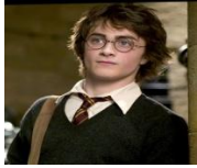
La familia de Harry Potter