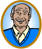
El Sr Potter es el abuelo de Harry