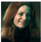
Lily es la madre de Harry