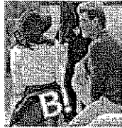
Viento de Malibú descubre el trasero de Salma Hayek