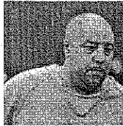
Asesino y violador el vecino del Secuestrador de Cleveland