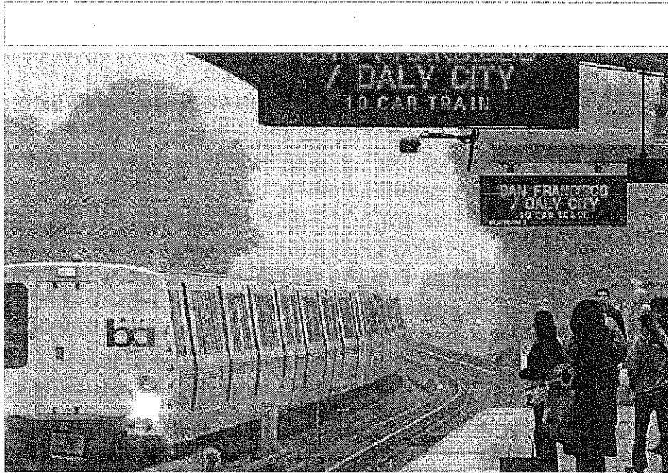
Pasajeros del sistema de transporte público por ferrocarril de San Francisco BART esperan la llegada del tren en Oakland, California.

El contrato entre los sindicatos y BART incluye un aumento del 15% del salario y mejores condiciones de seguridad