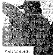
Qué hacer si tu ex ya tiene novia (Televisa -Portada)