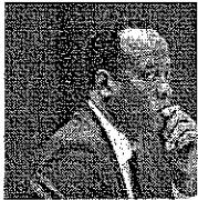
Médico de Michael Jackson demanda a Texas