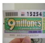
Número de lotería