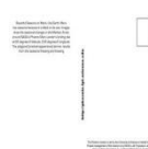
La tarjeta postal