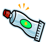
La pasta dental