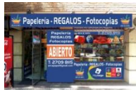
A la papelería